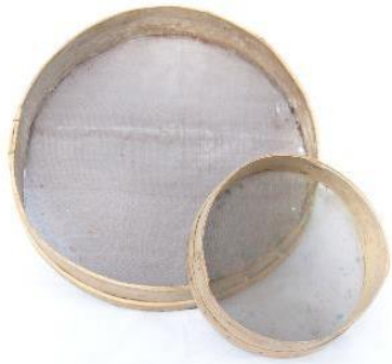
69. Jauhosihdit, Eila Leppänen