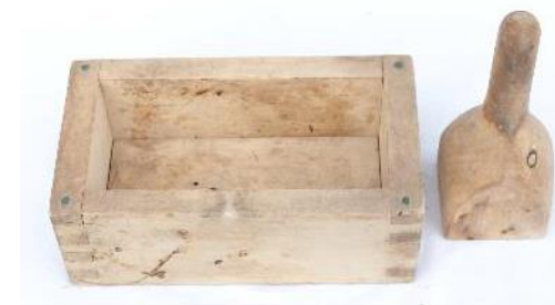
56. Kilon voimuotti, Eila Leppänen