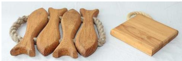
40. Pannunaluset, Maija Noponen