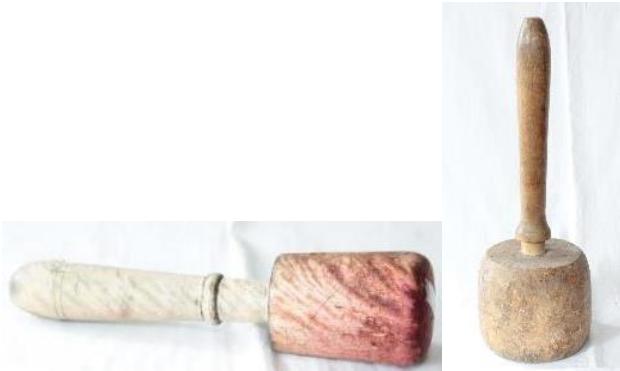
53. Puolukkanuija ja tavallinen nuija, Ritva Pykkänen